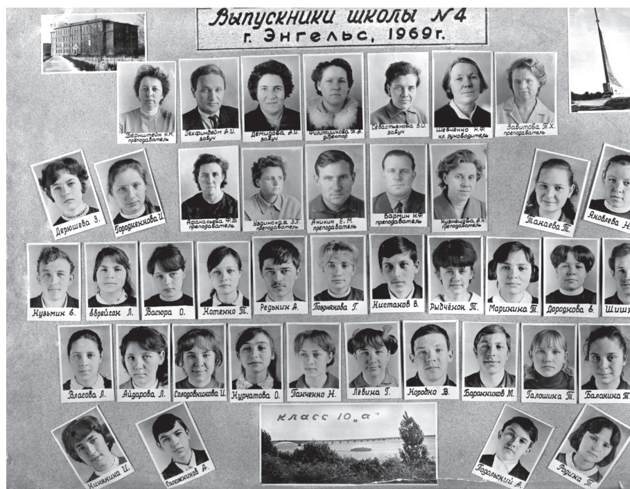
Фотография на память выпускникам 1969 года. Школа № 4