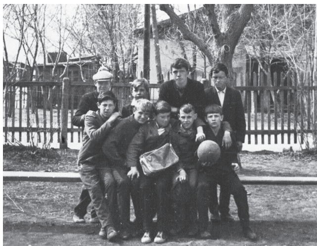
Во дворе школы № 22, 1960-е годы.