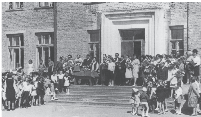
1 сентября, школа № 4