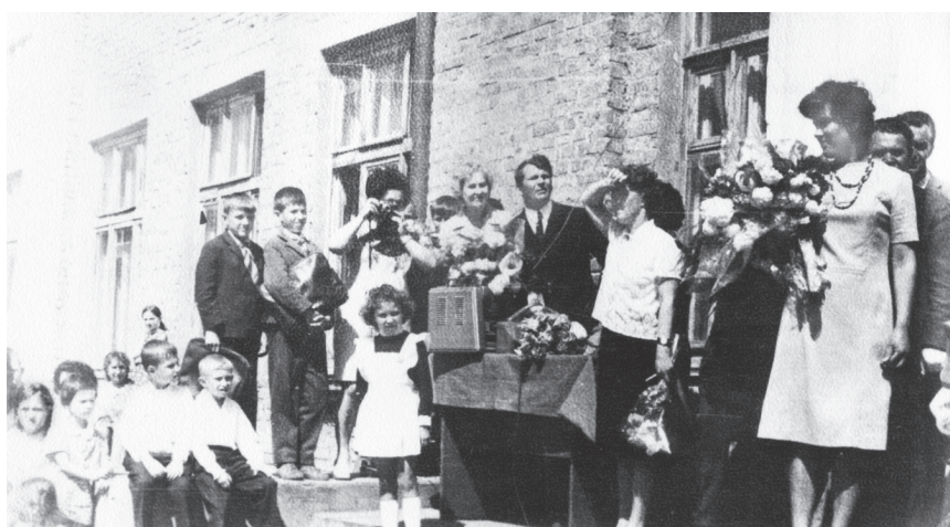
На крыльце школы № 4 1 сентября, начало 1970-х годов