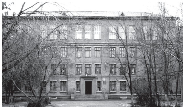
Средняя школа № 4.