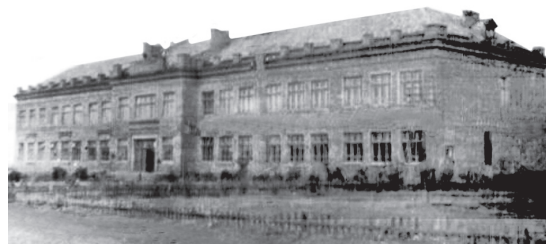
Школа № 16 Введена в строй в 1937 году. В 1949 г. школе присвоен № 4. В 1960-2000 годах здание занимала средняя школа № 22.

Детская память многое хранит. Но мне почему-то вспоминается зимняя поездка в 1943 году на аэродром, где в то время базировался женский авиационный полк. Зима была снежная, и надо было чистить лётное поле. Наше внимание привлекли самолёты, которые стояли в ряд. И нам хотелось подойти поближе и потрогать боевые машины. Ведь именно на них лётчицы полка защищали Саратовское небо.