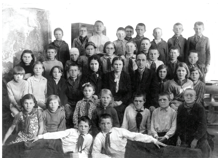
Учителя и учащиеся школы села Анисовка. 1939-1940 гг.