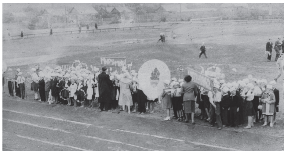
На стадионе – празднование Дня пионеров 19 мая 1962 года