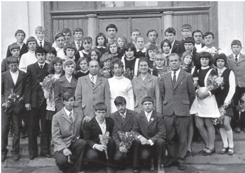
Выпускники восьмилетней школы № 22, 8 «В» класс.