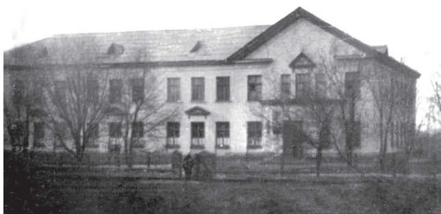
В здании, построенном в 1951 году, в 1950–1960-х годах учились «старые и малые» – учащиеся вечерней школы и ученики начальных классов 22-й школы. Снимок 1960-х годов