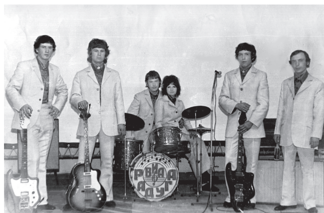
Вокально-инструментальный ансамбль «Радуга»