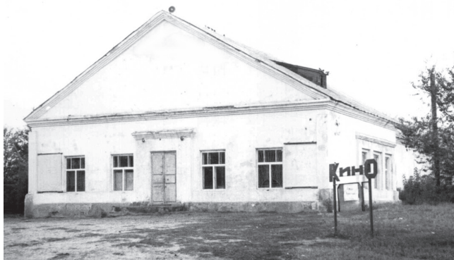
Здание клуба. Фото 1970-х годов.