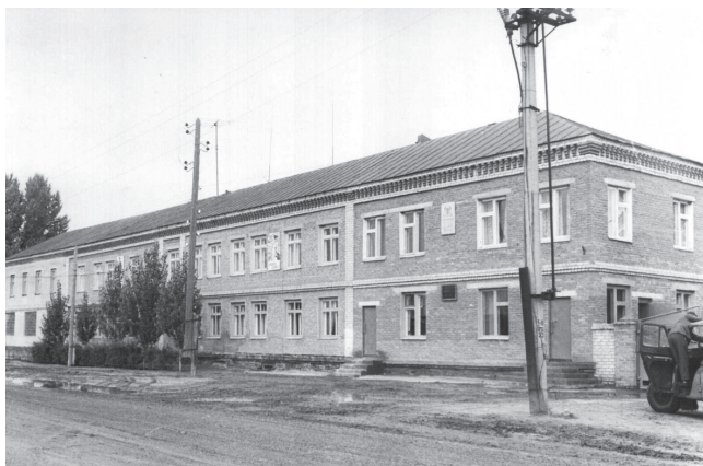
Квасниковка. Психоневрологический интернат.