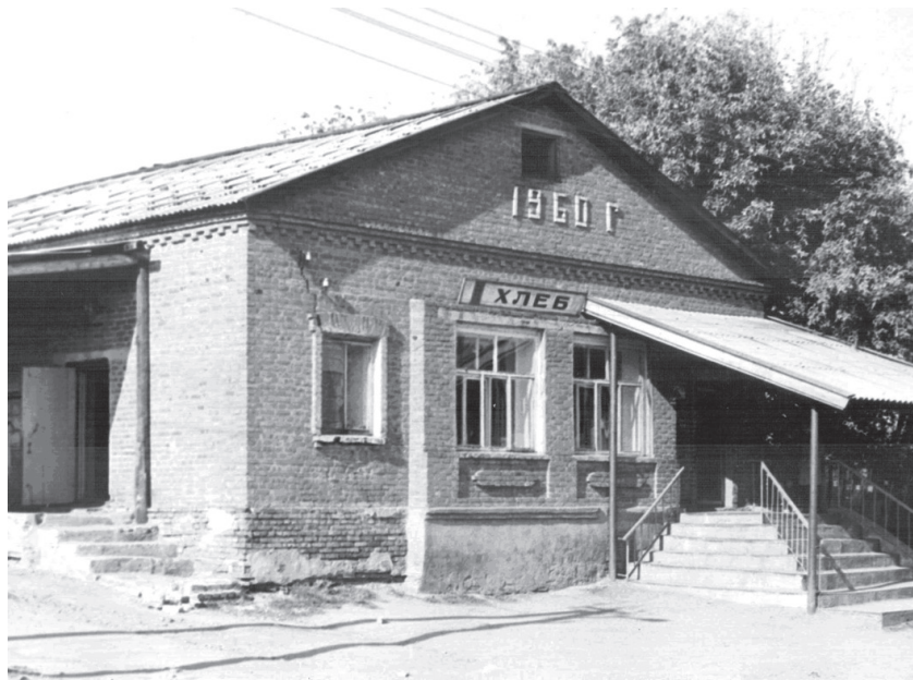
Хлебопекарня и магазин «Хлеб» в Квасниковке. Фото 1980-х годов.

требительских кооперативных организациях». В середине 1918 года встал вопрос о создании потребительского союза Немцев Поволжья, который бы стоял ближе к сельскому населению, лучше бы знал их особенности и требования. Собрание учредителей союза состоялось 7 июля 1918 года, на собрании присутствовало десять потребительских обществ.