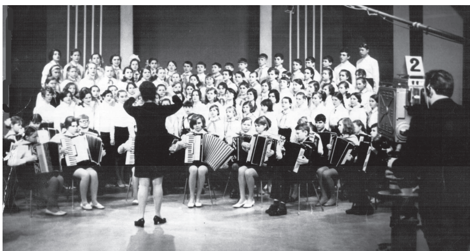
Выступление хора детской школы искусств № 2 на Саратовском телевидении