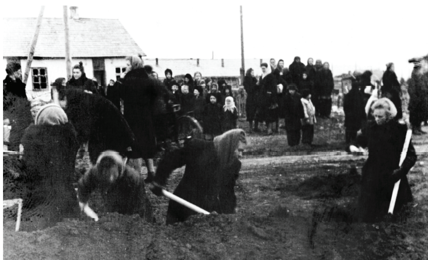
Строительство дворца культуры «Восход», сентябрь 1955 года.