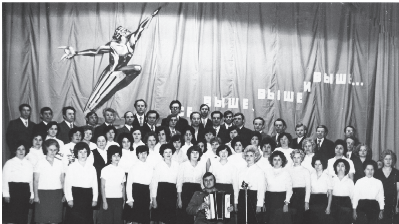
На сцене ДК «Восход» – хор ОКБ. Середина 1960-х годов