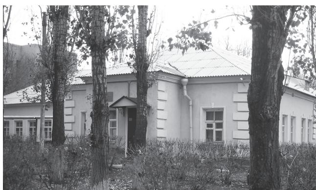
Детская музыкальная школа посёлка Приволжский, 2002 год