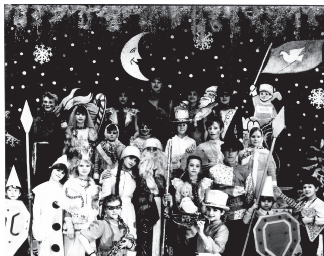
Танцевальный коллектив «Калинка» и театр-студия «Ману», 1982 год