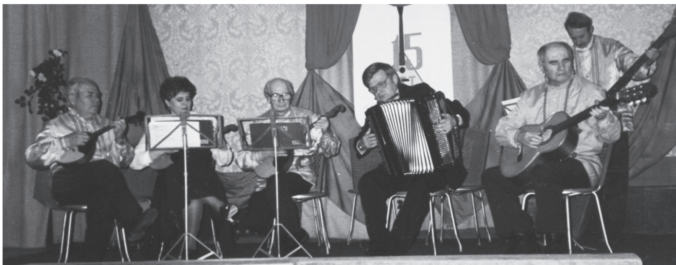
На сцене Дворца культуры «Восход» – ансамбль «Фантазия», 1990-е годы