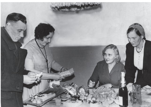
Правление клуба, 1957 год