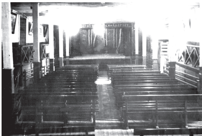
Старый клуб, располагавшийся в бараче.