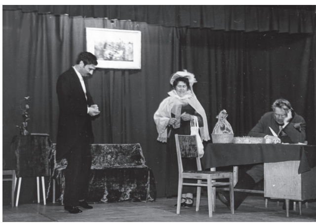
Сцена из спектакля А.П. Чехова «Юбилей», поставленного силами драматического кружка Дворца культуры «Восход»