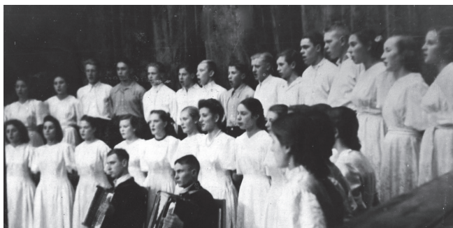
Всесоюзный смотр хоровых коллективов, 1955 год