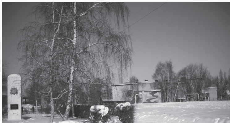
Дом культуры «Покровский», февраль 2011 года