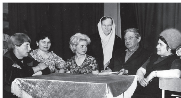
Заседание литературной гостиной