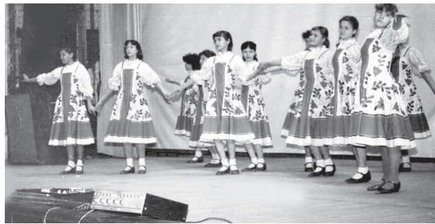
Ансамбль народного танца, 1979 год