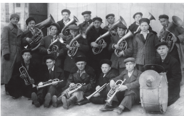
Духовой оркестр. 1950-е годы