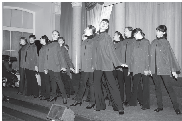
Праздничный концерт, посвящённый 50-летию Детской школы искусств № 2 города Энгельса, 2010 год