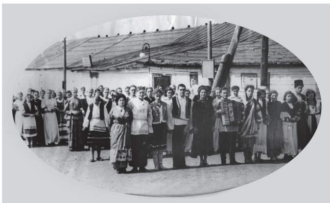
Творческие коллективы возле барака-клуба, 1957 год

Коллектив Дома культуры «Покровский» начал свою творческую деятельность в 1935 году в старом здании на базе мясокомбината. В учреждении действовало несколько коллективов самодеятельного творчества – драматический кружок, кружок вязания, танцевальный кружок. В течение последующих лет коллектив творчески развивался, организовывались новые кружки: хор русской песни, духовой оркестр, цирковой кружок, вокально-инструментальный ансамбль, проводились смотры цеховой самодеятельности.