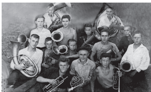
Духовой оркестр клуба Энгельского мясокомбината, 1946 год