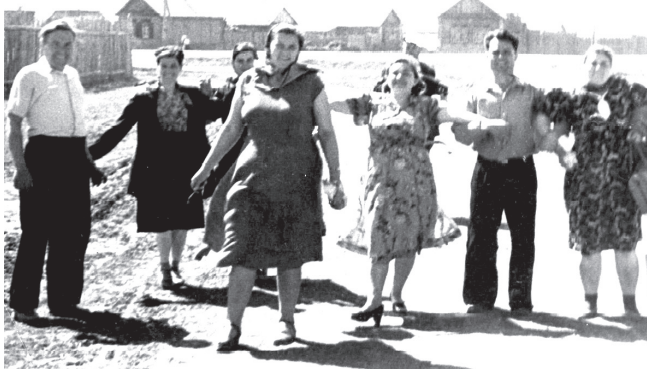
Праздник на улице Петровской, начало 1960-х годов

вначале занимался с ветеранами, а потом уже с профессиональными музыкантами. Вот почему я и сказал: «Сохраняют традиции».