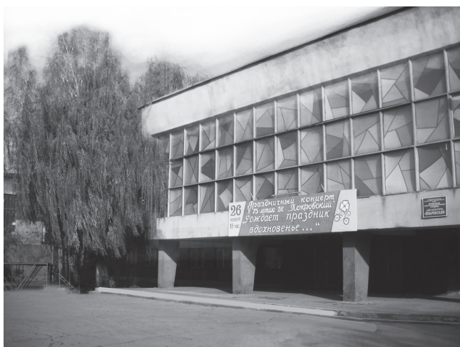
Дом культуры «Покровский» – бывший дом культуры Энгельского мясокомбината. 2010 год

Когда недавно во Дворце культуры «Восход» состоялся отчётный концерт ансамбля «Фантазия», после выступления мне хотелось выскочить на сцену и сказать участникам «Фантазии» огромное спасибо за доставленное удовольствие и за то, что они являются достойными продолжателями традиций старшего поколения нашего посёлка.