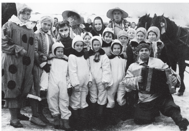
Проводы зимы, 1959 год