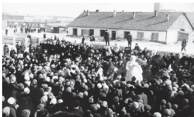
Проводы зимы, 1969 год