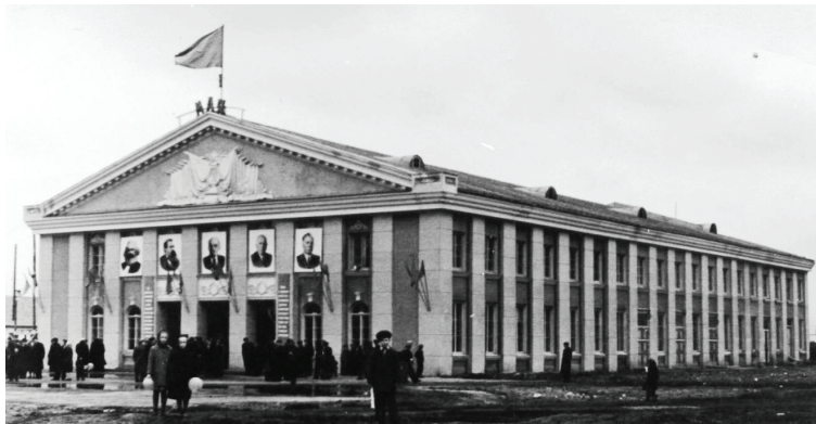
Дворец культуры «Восход» в посёлке Приволжском открыт в 1960 году

По истечении срока состав бригад менялся. С наступлением холодов продолжительность работы комсомольцев и молодёжи на стройке установили в пять дней.