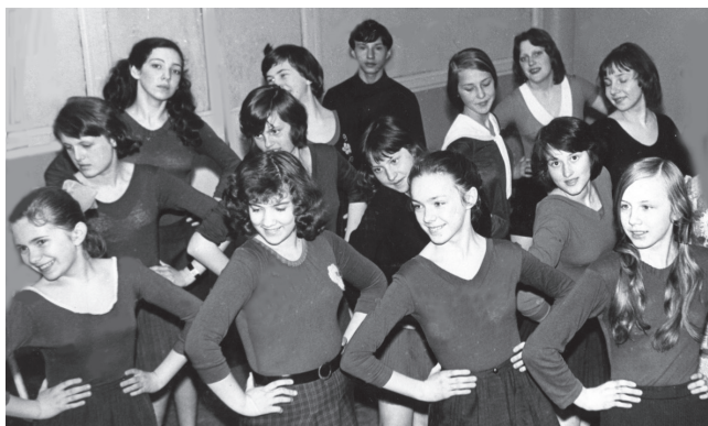
Танцевальный кружок, 1975–1977 годы